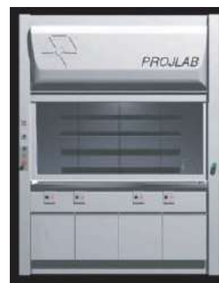
CAPELA COM SISTEMA INTERNO DE LAVAGEM DE GASES (PATENTE EXCLUSIVA)