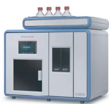
EXTRATOR DE SOLVENTES EVAPORADOR