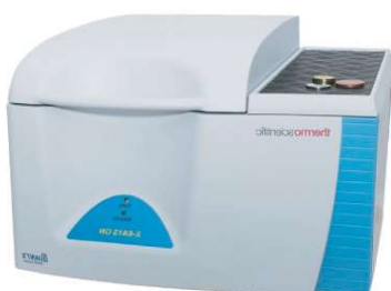
FLUORESCÊNCIA DE RX (EDXRF)