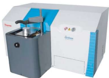
ESPECTRÔMETRO DE EMISSÃO ÓPTICA (OES)