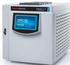
CROMATÓGRAFO À GÁS (GC)