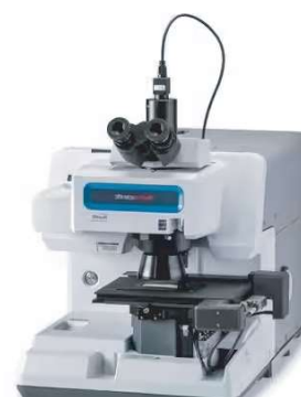
RaptIR MICROSCÓPIO FT-IR