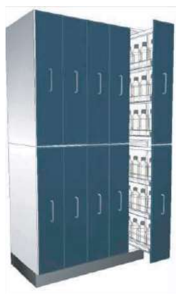
ARMÁRIOS PARA REAGENTES