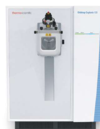
ORBITRAP (ALTA RESOLUÇÃO)