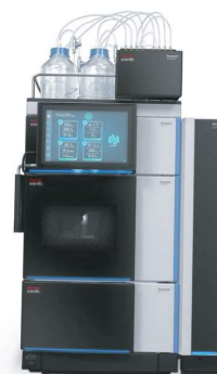
CROMATÓGRAFO À LÍQUIDO (LC)