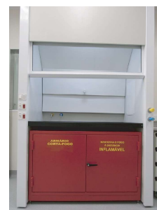
ARMÁRIO CORTA FOGO