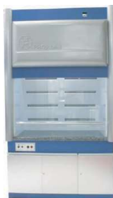
CAPELA DE EXAUSTÃO