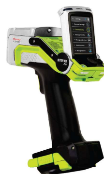
FLUORESCÊNCIA PORTÁTIL (XRF)