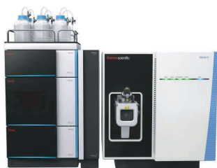
LC-MS / LC-MSMS