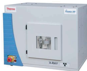
DIFRATOMETRO DE RX (DRX)