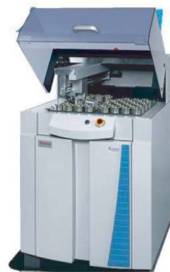
FLUORESCÊNCIA DE RX (WDXRF) SEQUENCIAL