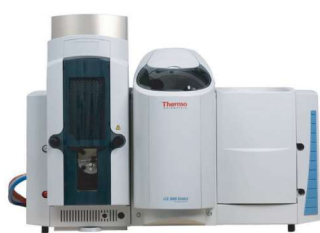
AA + FORNO