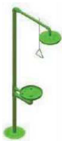
CHUVEIRO LAVA OLHOS