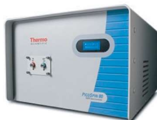
PICOSPIN 80 (RMN)