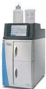
CROMATÓGRAFO DE ÍONS (IC)