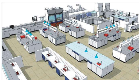
PROJETOS (Planta baixa e 3D)