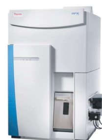
ICP-MS / ICP-MSMS