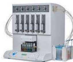
EXTRATOR DE FASE SÓLIDA