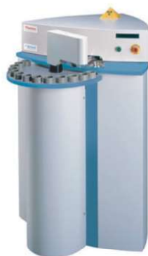
FLUORESCÊNCIA DE RX (WDXRF) SEQUENCIAL / SIMULTÂNEO