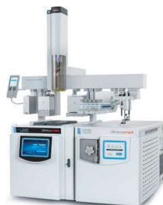
GC-MS / GC-MSMS