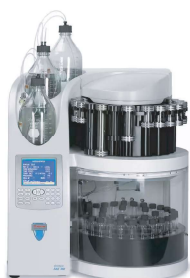
EXTRATOR DE SOLVENTES